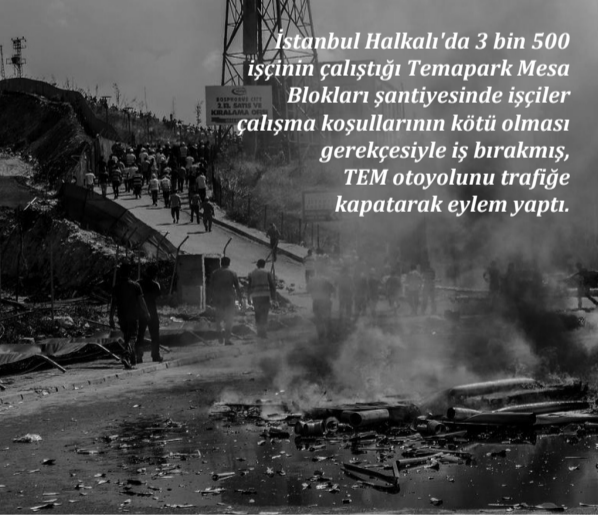
Istanbul Halkalı'da 3 bin 500 işçinin çalıştığı Temapark Mesa Blokları şantiyesinde işçiler çalışma koşullarının kötü olması gerekçesiyle iş bırakmış, TEM otoyolunu trafiğe kapatarak eylem yaptı.

Yunanistan'da eğitim emekçileri Aralık ayında alanlardaydı. Hükümetin, emperyalist merkezlerin yönlendirmesi ve kontrolü altında uyguladığı kemer sıkma ve ekonomik istikrar politikalarına karşı büyük bir öfke ile sokakları dolduran eğitim emekçilerine, değişik sektörlerden emekçiler kitlesel destek sundular.