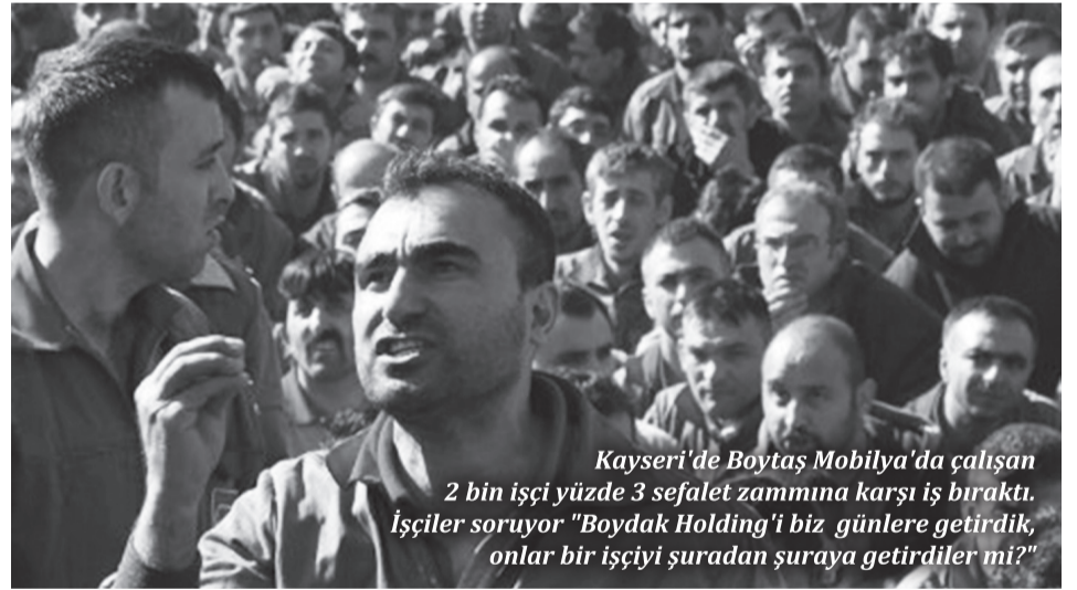
Kayseri'de Boytaş Mobilya'da çalışan 2 bin işçi yüzde 3 sefalet zammına karşı iş bıraktı. İşçiler soruyor "Boydak Holding'i biz günlere getirdik, onlar bir işçiyi şuradan şuraya getirdiler mi?"

Şimdi görev metal işçilerin mücadelesinin parçası olmak ve sahici dayanışma eylemleri örgütlemektir.