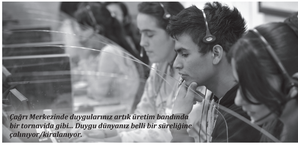
Çağrı Merkezinde duygularınız artık üretim bandında bir tornavida gibi... Duygu dünyanız belli bir süreliğine çalışmıyor/kiralaniyor.

İlk altı ay için en düşük ücretli işçi yüzde 40 zam alırken, yüksek ücretli işçi yüzde 10 zam aldı. Böylelikle işçiler arası ücret farkı giderilirken, ortalamada yüzde 14 zam kazanılmış oldu.