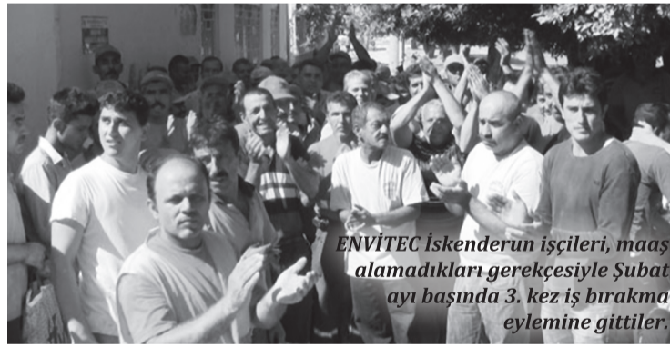
ENVİTEC İskenderun işçileri, maaş alamadıkları gerekçesiyle Şubat ayı başında 3. kez iş bırakma eylemine gittiler.

Mesai kimi zaman 17.00'da kimi zaman sabaha karşı 03.00'da başlar. Ürettikleri hizmetin kendilerine neye mal olduğunu, 11 aydır düzenli maaş alamayan ve en son Şubat ayı başında 3. defa