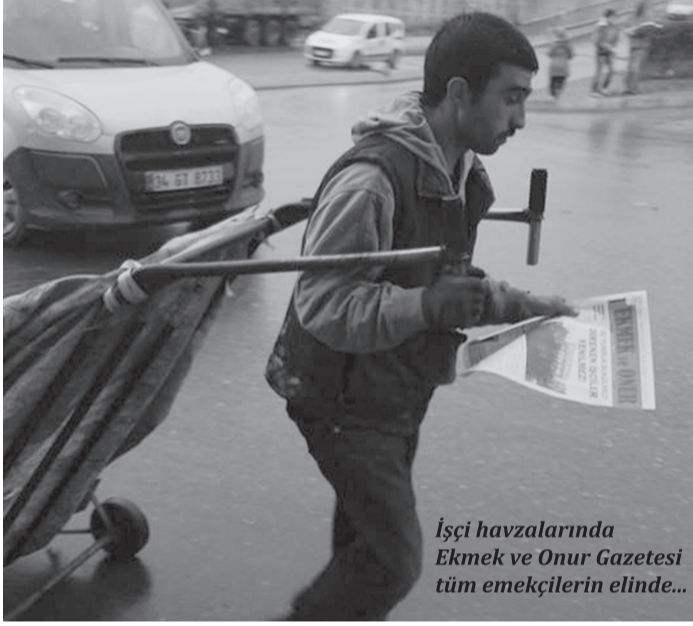
İşçi havzalarında Ekmek ve Onur Gazetesi tüm emekçilerin elinde...